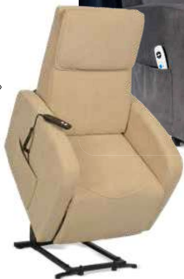
DIMENSIONS EN CM. + ou - 2cm