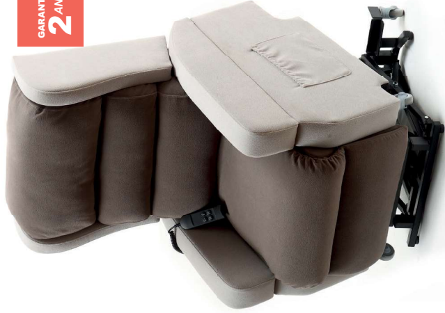
MICROFIBRE MIXTE POLYDUO R+ (EXPLICATIONS PAGE 10)

Le traitement Easyclean permet un simple nettoyage à l'eau pour enlever les tâches domestiques les plus communes (café, vin, encre, chocolat...). Il évite l'infiltration immédiate des liquides (propriété déperlante) afin que ceux-ci puissent être absorbés à l'aide d'un simple chiffon propre (de préférence 100% coton). Ce revêtement est également traité contre le développement des champignons, moisissures et bactéries évitant ainsi l'apparition d'odeurs causées par des micro-organismes. Il répond également à la norme Oeko-Tex 100 garantissant son innocuité et l'absence dans sa composition de 100 substances identifiées comme potentiellement nocives ou toxiques pour la santé et l'environnement.